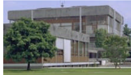
Bundesverfassungsgericht

Am 25. Februar 2009 hat das Bundesverfassungsgericht eine Entscheidung in einem Fall verkündet, der nahezu unglaublich erscheint. Eine an amyotropher Lateralsklerose (ALS) erkrankte Frau hatte im September 2007 bei ihrer Krankenkasse einen speziellen, mit dem Mund steuerbaren Elektro-Rollstuhl beantragt, um sich bei Abwesenheit ihres sie pflegenden Ehemannes in ihrer Wohnung fortbewegen zu können. (ALS ist die Erkrankung, an der vor etwa zwei Jahren der Maler Jörg Immendorff starb und von der auch der weltberühmte Astrophysiker Stephen Hawking seit über 40 Jahren betroffen ist.) Die Krankenkasse veranlasste eine Begutachtung durch den TÜV; dieser stellte fest, dass die Frau einen Elektro-Rollstuhl im Straßenverkehr nicht führen könne. Daraufhin lehnte die Krankenkasse den Antrag ab.